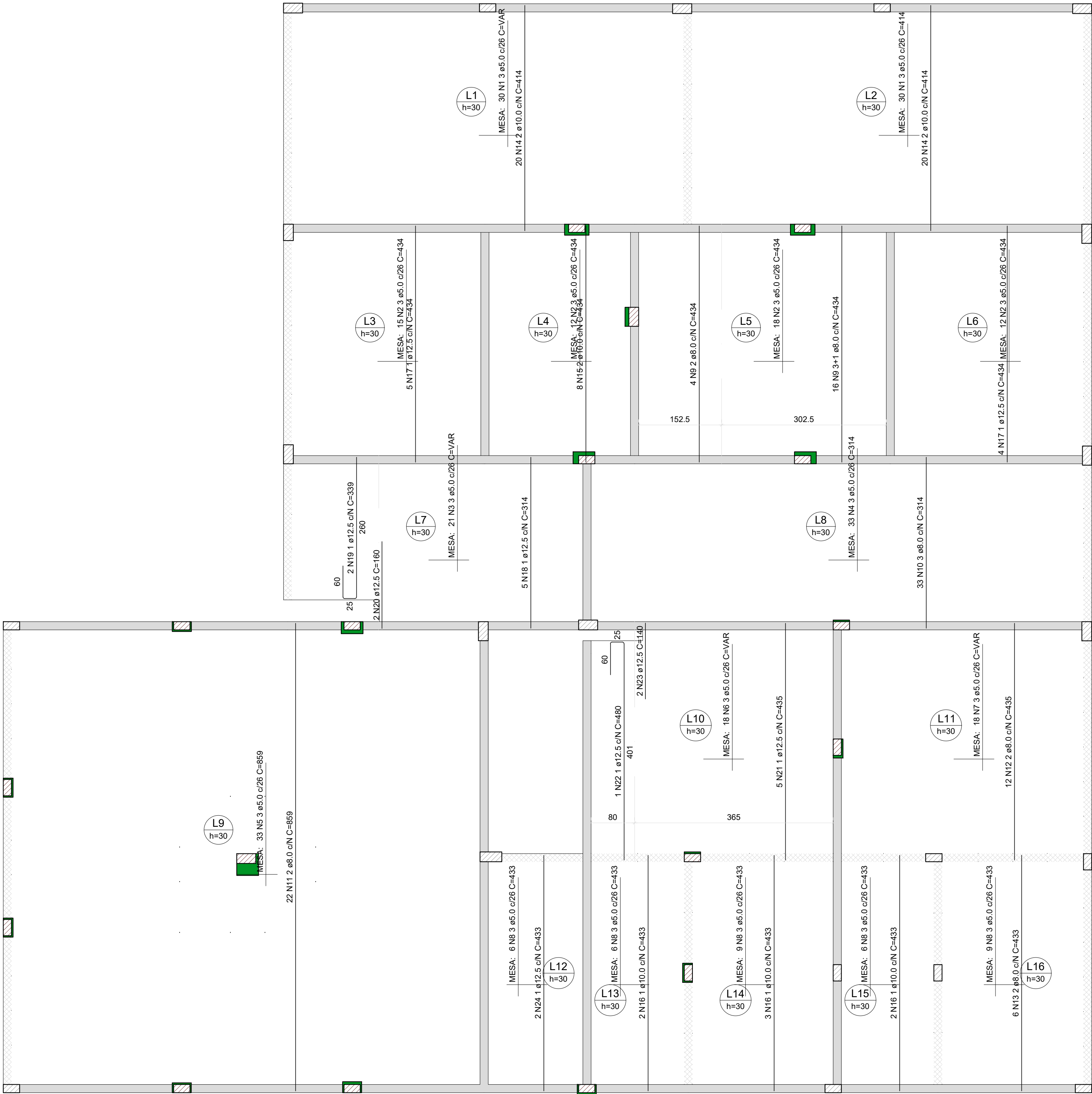
Armação positiva das lajes do pavimento Térreo (Eixo Y)